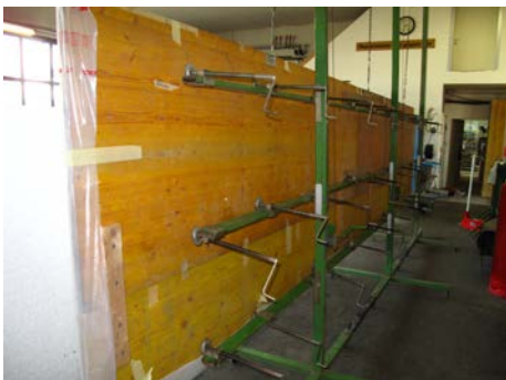
4. Detailansicht: Anpressvorrichtung vorbereiten