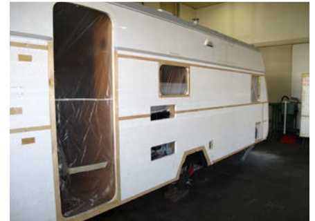
3. Vorbereiteter Caravan für die Neuverblechung