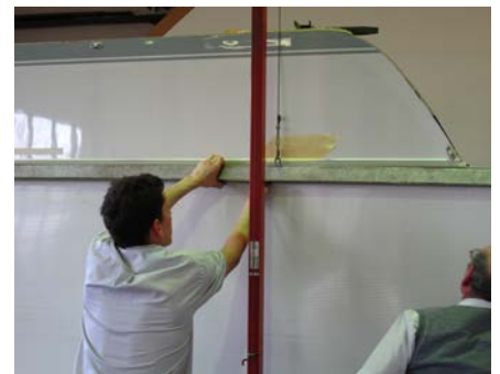
11.2 ...positioniert und...