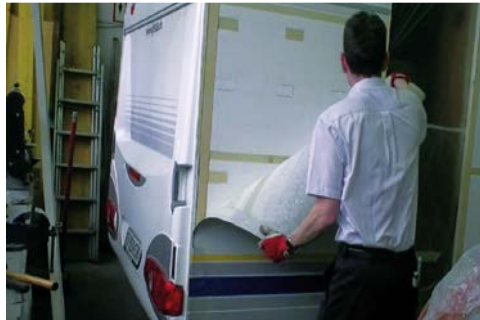
2. Abschälen des beschädigten Alublechs