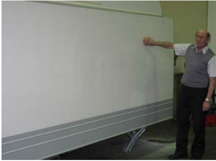
13. Anpressvorrichtung entfernen