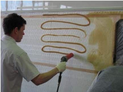
9. Jetzt wird der Klebstoff aufgetragen...

Unmittelbar vor dem Auflegen des Bleches wird auf den Klebstofffilm und das Blech gleichmäßig Wasser aufgesprüht ( 20-40 \text{ g/m}^2 ). Anschließend muss das Blech sofort aufgelegt bzw. angedrückt und bis zur Aushärtung des Klebstoffes unter Fixierdruck gehalten werden, der einen vollständigen Kontakt der Klebeflächen gewährleistet. Bei +20 \text{ }^\circ\text{C} ist dafür eine Zeit von mindestens 6 Stunden erforderlich. Die Endfestigkeit wird erst nach mehreren Tagen erreicht. Der CARAVAN-KLEBER ist nicht geeignet für Blech-auf-Blechverklebungen. Bei Anfragen oder etwaigen speziellen Anwendungsproblematiken stehen wir Ihnen gern zur Verfügung.