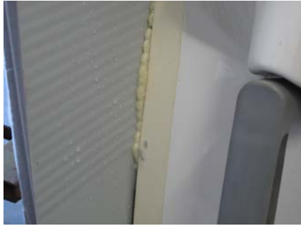
13.1 Hier ist gut sichtbar...