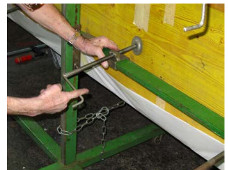
12.1 ... und abschließendes Verpressen (ca. 6 Std. bei +20 \text{ }^\circ\text{C} ).