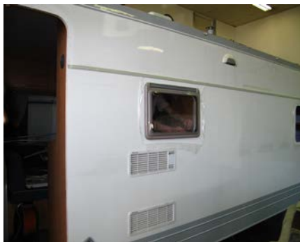
15. ... fast fertig!