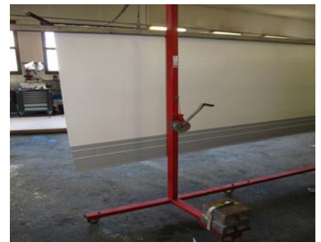
6. Montagehilfe für die spätere exakte Positionierung