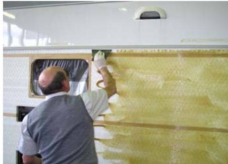
10.1 ...und anschließend ...