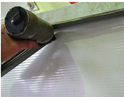
11.3 ...fixiert (Klammern, Nägel, usw.)