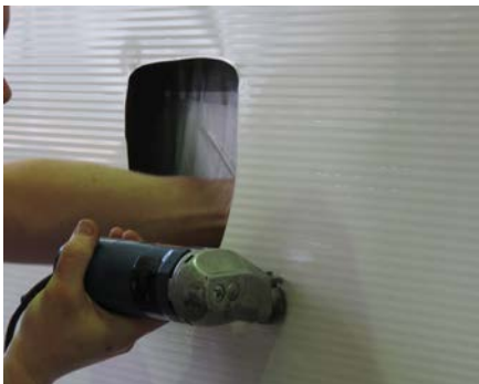
14. Nun können Fenster, Türen und Luken ausgeschnitten werden...