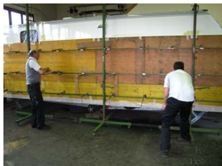
12. Anbringen der Anpressvorrichtung...