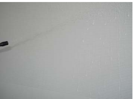
7.1 Das Blech wird sorgfältig mit Feuchtigkeit benetzt...