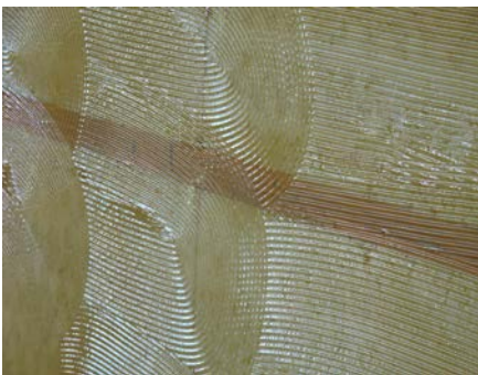
10.3 ... gleichmäßig verteilt. Der Klebstoff füllt kleine Löcher, Spalten und Vertiefungen aus.