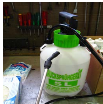
7.2 ...dabei hilft das Wassersprüngerät.