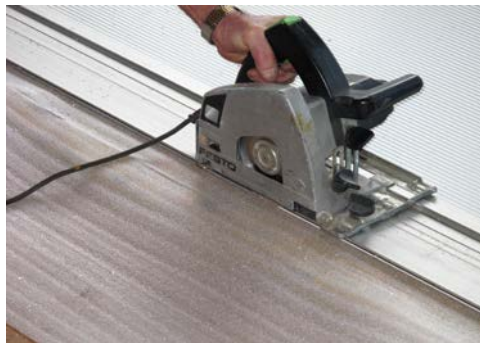
5. Blech wird zugeschnitten